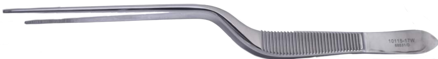
10115-17W ルーチェ鼻用ピンセット